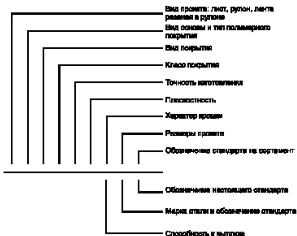
Схема условных обозначений проката с полимерным покрытием

Примечание — При отсутствии какого-либо из параметров его выбирает предприятие-изготовитель.